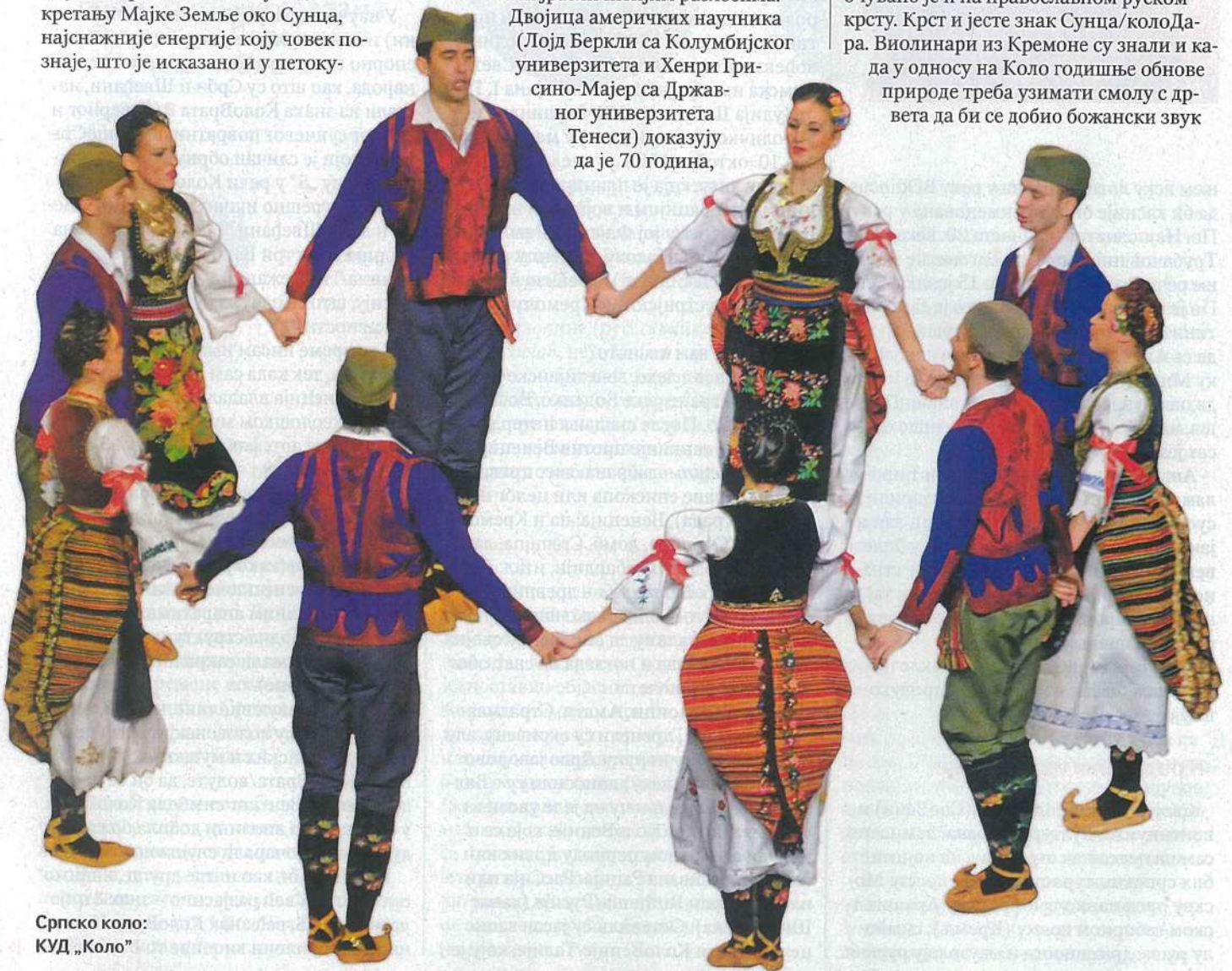
Српско коло: КУД „Коло“

Тајна је у томе што су виолинари из Кремоне знали значење јогова за наставак културе од времена Лепенског вира и Винче, знали за значење КолоВрата, а на основу тога и када треба сећи дрво за израду виолине да би годови били божански распоређени јер S-образни отвори имају и узлазни и силазни знак, што није без икаквог смисла постављено и очувано је и на православном руском крсту. Крст и јесте знак Сунца/колоДара. Виолинари из Кремоне су знали и када у односу на Коло годишње обнове природе треба узимати смолу с дрвета да би се добио божански звук