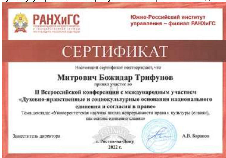
Фото бр. ....: Сертификат о мом учешћу 2. новембра 2022. године на научној конференцији на универзитету РАНХиГС у Ростову на Дону са научним радом под називом «Универзитетска научна школа НЕПРЕКИДНОСТИ ПРАВА И КУЛТУРЕ (СлоВена) као основ обједињавања СлоВена»