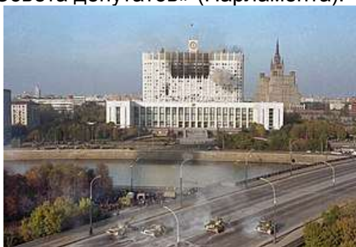
Фото ..... бр. ...б. Тенковима на руски парламент 4. октобар 1993. године – друга фаза Другог Хазарског пуча