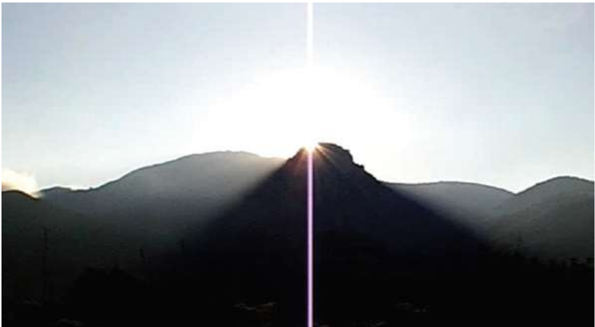
Како је у епоху Лепенског Вира настала идеја «право» (от Бога)

Наши преци су то схватили као почетак или праПочетак (первоНачало), то јест, «Аз» Божанског, узајамног цикличког кретања и од њега почели да формирају појам «право» за заштиту Божанског и људског поретка.